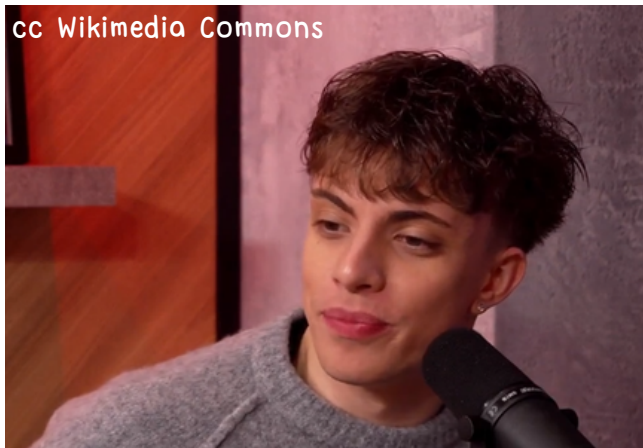
Anyme pendant l'enregistrement du podcast "Zack en roue libre", le 25 mai 2025