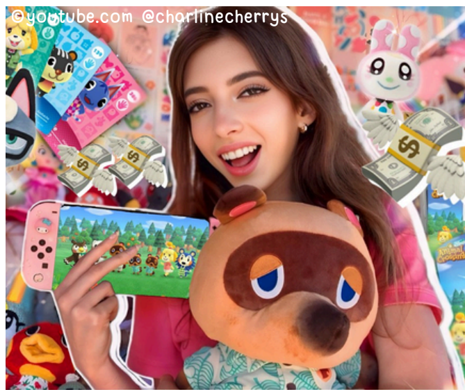
Vignette de la vidéo "mon incroyable collection Animal Crossing" publiée le 10 juillet 2024 sur YouTube