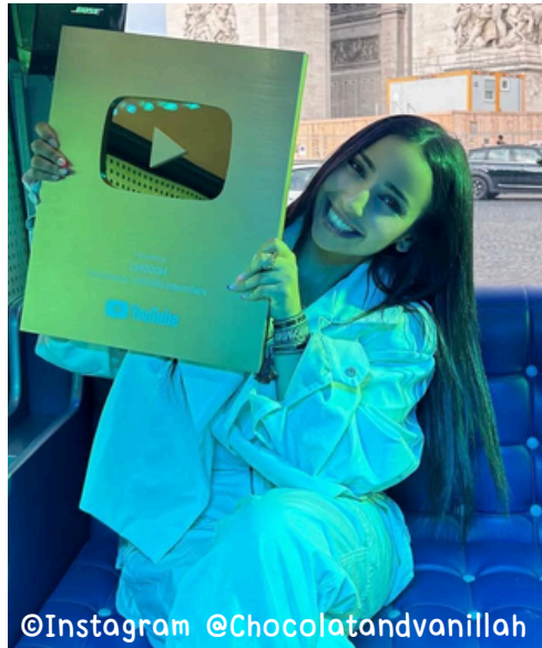
Chocoh fête son million d'abonnés en juillet 2023

Retrouve l'interview de Chocoh par la chaîne Melty le 22 octobre 2024