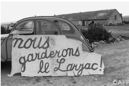
La formule restée célèbre qui a symbolisé le mouvement

Un évènement majeur, la lutte du Larzac, plus récent a aussi participé à la réputation de notre terre et à son patrimoine fort. Dans les années 1970, l'État veut agrandir le camp militaire du Larzac, ce qui menace les terres de nombreux paysans.