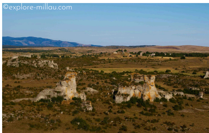
Le plateau du Larzac et ses grands espaces

L'UNESCO a reconnu le site Causses et Cévennes le 8 juin 2011 pour son agropastoralisme méditerranéen omniprésent encore actif aujourd'hui et qui a modelé ses paysages : terrasses, drailles, bergeries en pierre sèche et villages traditionnels. Cette inscription met en valeur un mode de vie respectueux de l'environnement, fondé sur l'adaptation aux contraintes naturelles et la transmission des savoir-faire.