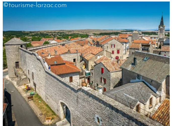
La Cavalerie, village templier et hospitalier

Qu'ils se retrouvent à la Couvertoirade, à Saine Eulalie, ou encore à l'Abbatiale de Saint Pierre, les visiteurs peuvent s'immerger dans le monde des Templiers et des Hospitaliers.